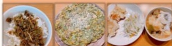
👑 グランプリ 👑