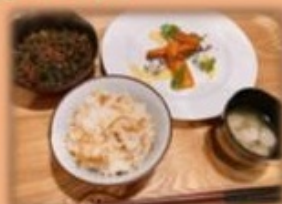
👑 準グランプリ 👑