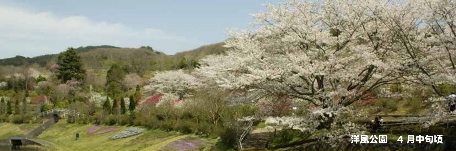
洋風公園 4月中旬頃