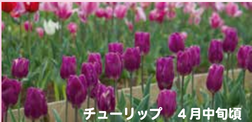
チューリップ 4月中旬頃