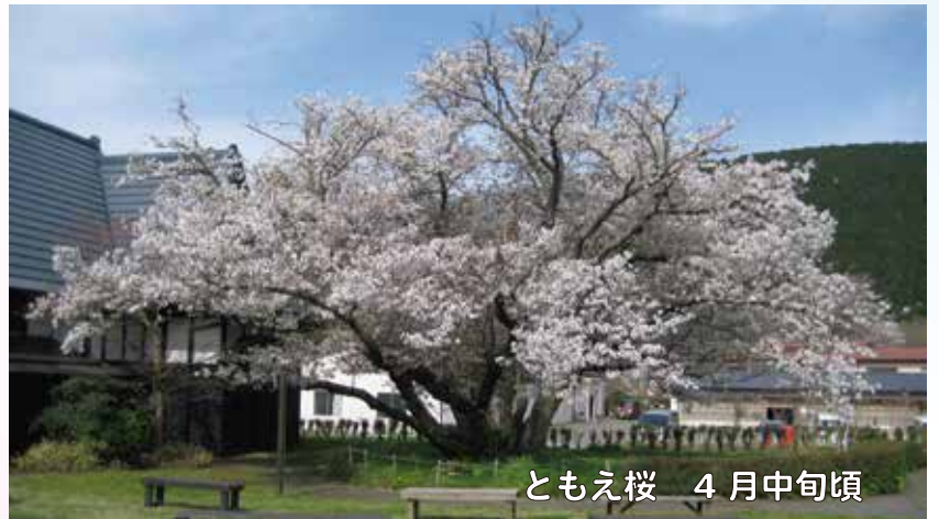
ともえ桜 4月中旬頃